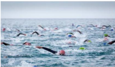
3.8 km Schwimmen

Ein Verschiebedatum ist auf den Sonntag, 5. September 2021 festgesetzt.