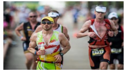
42.2 km Laufen