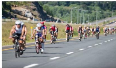
180 km Fahrradfahren